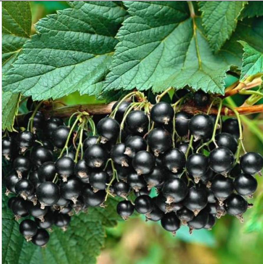
Рис. 3.3. Сорт смородини чорної ВАСИЛЬКІВСЬКА

Сорт Столична Української колекції виведений в інституті садівництва за схрещування сорту Титанія х Трітон. Сорт ранньостиглий, ягодо округлопродовгувата темна вагою до 2,5 г. Стебла напіврозлогі висотою 1,1 метра, стійкий до грибних хвороб.