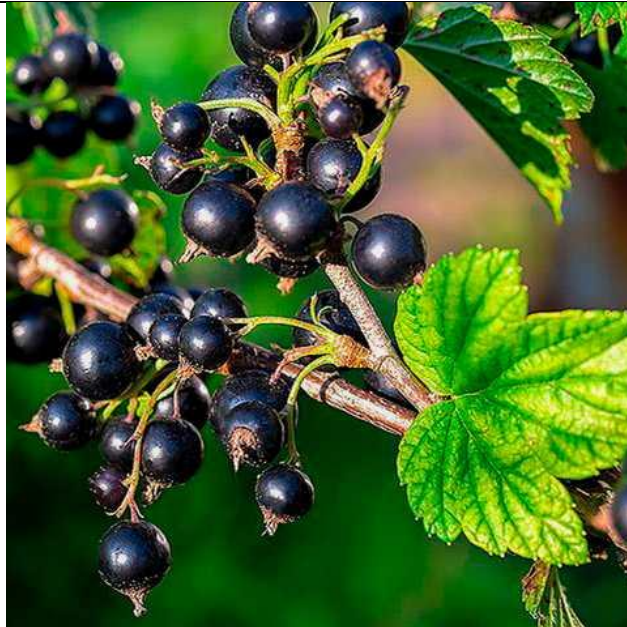
Рис. 3.1. Сорт смородини чорної КИЇВЛЯНКА

Основним завданням нашої програми щодо виконання дипломної роботи було вивчення біологічної стійкості різних сортів смородини чорної проти великої смородинової попелиці. Характеристика сортів смородини чорної Київлянка, Столична, Васильківська, Копаня, Ізумрудна приведені в на рис. 3.1 – 3.5.