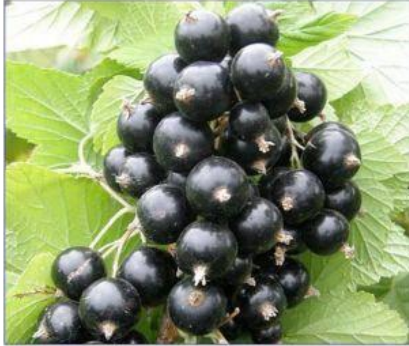
Рис. 3.4. Сорту смородини чорної КОПАНЯ