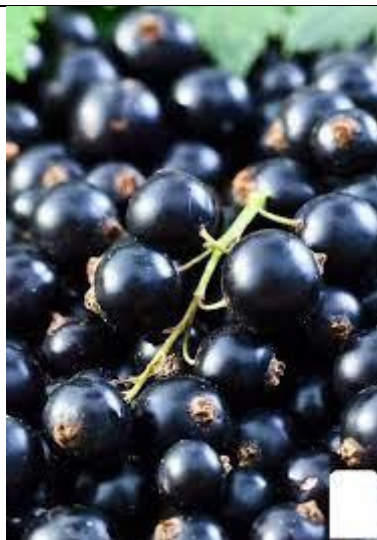
Рис. 3.2. Сорт смородини чорної СТОЛИЧНА