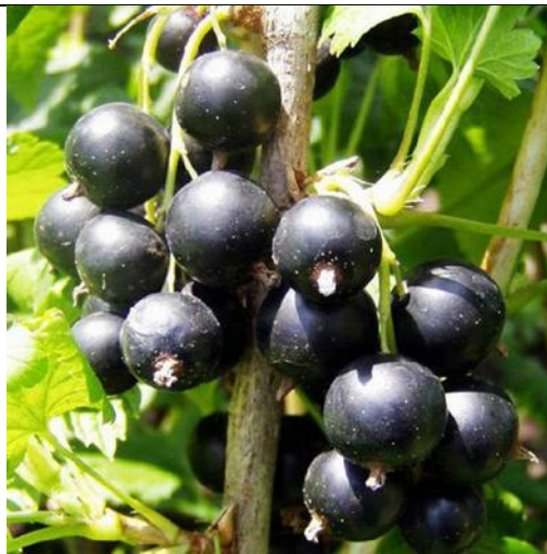
Рис. 3.5. Сорту смородини чорної ІЗУМРУДНА