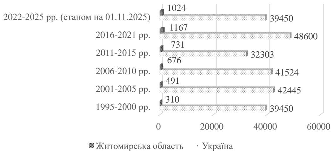
Рис. 2.2. Динаміка кількості малих аграрних господарств в Україні та Житомирській області, од.

поступове зменшення кількості малих аграрних підприємств (рис. 2.2) [9]. Водночас, темпи скорочення малих аграрних підприємств у Житомирській області є нижчими, у порівнянні з середніми статистичними даними по Україні, що вказує на релокацію бізнесу з півдня та сходу України до північно-західних областей. Така тенденція свідчить про підвищення підприємницької активності у сільському секторі Житомирської області та розширення можливостей для розвитку місцевого бізнесу.