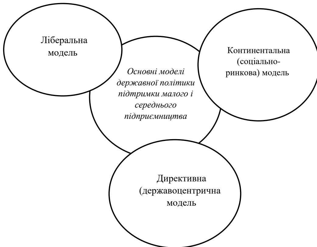
Рис. 1.1. Моделі державної політики щодо підтримки малих та середніх підприємств

У світовій практиці існують три основні моделі державної політики щодо підтримки малих та середніх підприємств, включаючи аграрний сектор (рис. 1.1).