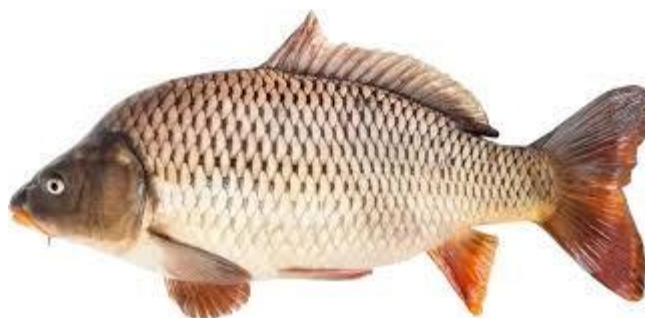
Рис. 1. Короп звичайний (Cyprinus carpio L.)

За екстер'єрними ознаками тіло коропа видовжене, злегка стиснуте з боків і вкрите великою, щільно прилеглою циклоїдною лускою, забарвлення якої варіює від сріблясто-жовтого до насиченого золотисто-брунатного (залежно від умов середовища та породної лінії). Кожна лусочка має характерну темну пігментацію біля основи та чітку облямівку по краях. Голова відносно велика, з широким лобом і тупим рилом. Рот кінцевий, висувний, що є еволюційним пристосуванням до пошуку корму на дні; на верхній губі розташовані дві пари вусиків, які виконують функцію тактильних і хеморецепторів. Специфічною анатомічною особливістю є наявність потужного жувального апарату — трьох рядів міцних глоткових зубів, розташованих на останній зябровій дузі, за допомогою яких риба перетирає тверду їжу (наприклад, панцири молюсків) [8, 14, 33].