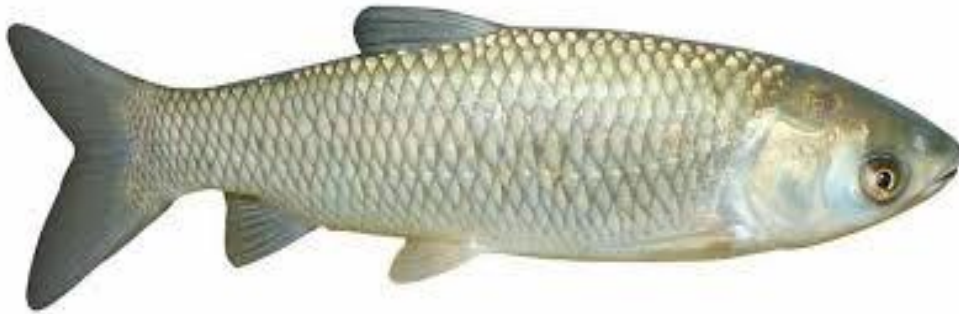
Рис.3. Білий амур ( Stenopharyngodon idella )

Білий амур ( Stenopharyngodon idella ) є одним із найцінніших об'єктів прісноводної аквакультури, який поєднує продуктивне та біомеліоративне значення. У ставкових господарствах цей вид використовують не лише для одержання товарної риби, а й як ефективний природний регулятор надмірного розвитку водної рослинності, що має важливе практичне значення для підтримання належного гідробіологічного режиму водойм. Завдяки такій харчовій спеціалізації білий амур посідає важливе місце у полікультурі, оскільки використовує кормові ресурси, які майже не залучаються іншими видами риб [32, 43].