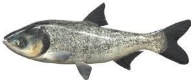
Рис. 2. Товстолобик строкатий ( Hurrophthalmichthys nobilis )

Товстолобик строкатий ( Hurrophthalmichthys nobilis , синонім — Aristichthys nobilis ) є одним із найцінніших представників комплексу далекосхідних рослиноїдних риб, успішно акліматизованих у вітчизняних водоймах. Його ключова роль у ставковій аквакультурі базується на біологічних принципах полікультури — спільного вирощування гідробіонтів, які займають різні просторові та трофічні ніші. Оскільки цей вид живиться переважно в товщі води, він практично не вступає у харчову конкуренцію з типовим бентофагом — коропом. Це дозволяє максимально повно утилізувати природну кормову базу водойми та суттєво підвищити її загальну рибопродуктивність без додаткових витрат на штучні корми [10, 26, 34].