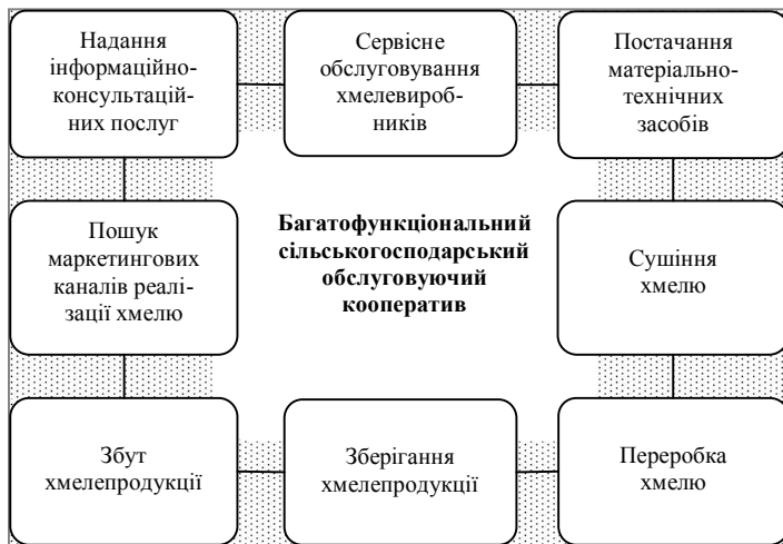
Рис. 2. Функції багатофункціонального сільськогосподарського обслуговуючого кооперативу

В умовах посиленої конкуренції на ринку хмелю суттєвого значення набуває створення багатофункціональних сільськогосподарських обслуговуючих кооперативів. Пріоритетними завданнями багатофункціонального кооперативу є поєднання функцій маркетингового, постачальницького, сервісного, збутового, переробного кооперативів (рис. 2). Такий вид інтеграційних зв'язків забезпечить безперервний процес виробництва, переробки та зберігання, а також мінімізацію витрат для хмелевиробників, пов'язаних безпосередньо з виробництвом хмелю.