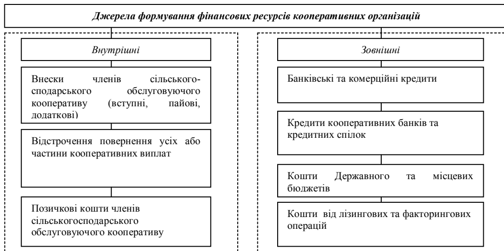
Рис. 3. Джерела мобілізації фінансових ресурсів сільськогосподарськими обслуговуючими кооперативами