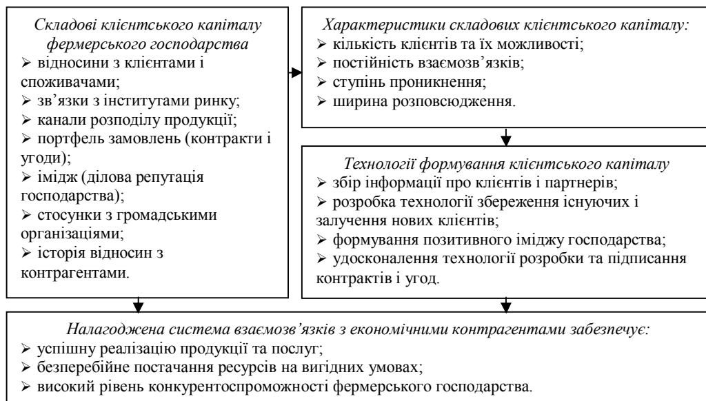
Рис. 1. Система формування клієнтського капіталу фермерського господарства