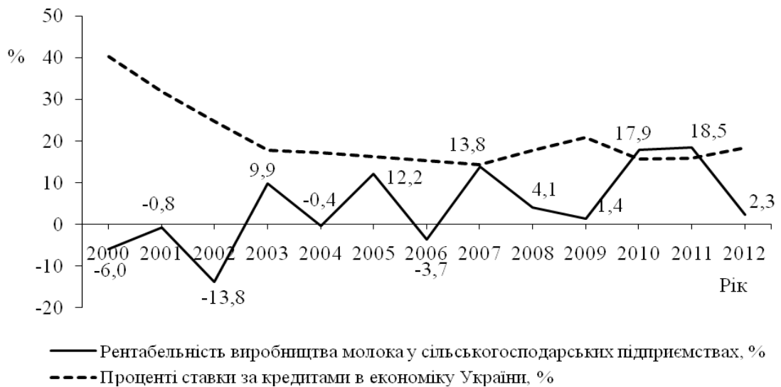
Рис. 2. Відношення рентабельності виробництва молока та середньозваженої процентної ставки за кредитами в економіку, %.

Комерційні банки для сільськогосподарської галузі в цілому та відродження скотарства зокрема, враховуючи вищу ризикованість ведення бізнесу встановлюють ще вищі кредитні ставки. Так, процентна ставка за новими кредитами для сільськогосподарських підприємств у грудні 2012 р. становила 21,6 % та збільшилась проти січня місяця цього ж року на 3 процентні пункти. Найнижчі відсоткові ставки, до 15–16 % річних за виданими кредитами, для аграрного сектора фіксувалися лише у 2011 р. Найвищою була вартість кредитів у національній валюті, наданих банками Житомирської області, – 25,3% річних в листопаді 2013 року. [2]. За існуючої ситуації, для того щоб інвестувати кошти у відродження скотарства, вартість кредитних ресурсів має бути значно нижчою. Завищені кредитні ставки роблять продукцію неконкурентоспроможною, а самі сільськогосподарські підприємства низько рентабельними.