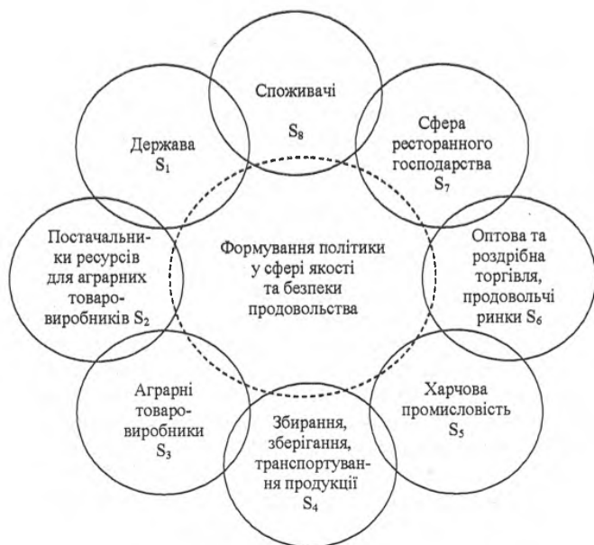
Рис. 2. Схема інформаційного обміну та взаємодії суб'єктів системи забезпечення якості та безпеки продовольства

Еластичність базується на інформаційно-комунікаційному процесі між основними суб'єктами системи і залежить від сукупності факторів, які створюють умови для їх збалансованої взаємодії, що регулюється державою. Подана на рисунку 2 модель взаємодії суб'єктів системи забезпечення якості та безпеки продовольства – держави, виробників, сфери зберігання, переробки, транспортування, торгівлі, ресторанного господарства, споживачів – дозволяє розкрити сутність еластичності як властивості, що забезпечує дифузійне і пряме поширення інформації в системі.