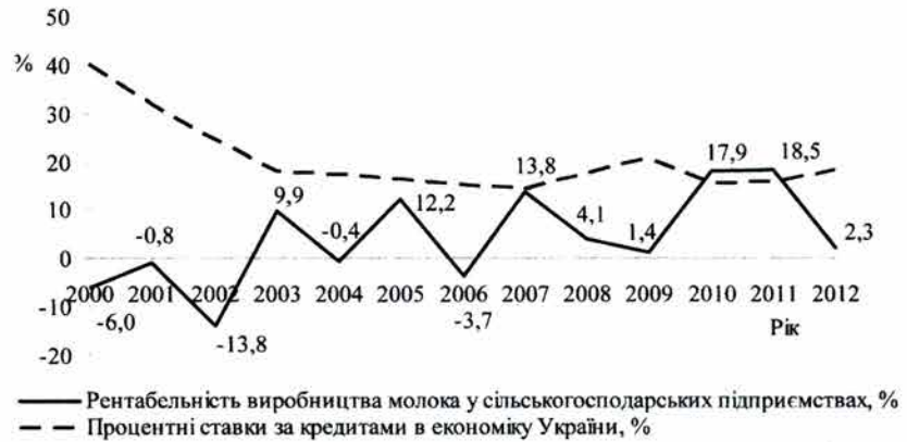
Рис. 2. Рентабельність виробництва молока у сільськогосподарських підприємствах та середньозважені у річному обчисленні процентні ставки за кредитами в економіці, %

Не є вирішенням і державна підтримка кредитування галузі за рахунок кредитних гарантій та субсидування процентних ставок. Відшкодування процентних ставок за кредитами, виданими сільськогосподарським підприємствам, здійснюється на конкурсній основі згідно з поданими заявками, що не знижує ризик неповернення самої позики. Окрім того, реалізація кредитної державної підтримки у повному обсязі постійно потребуватиме значних витрат державних ресурсів. Враховуючи обмеженість бюджетних коштів, слід зосередити діяльність на такій підтримці кредитного забезпечення молочнотоварного виробництва, яке б стимулювало проведення структурних змін та запровадження прогресивних технологій у тваринництві, а також не було б обтяжливим для бюджету. Перспективним інструментом фінан-