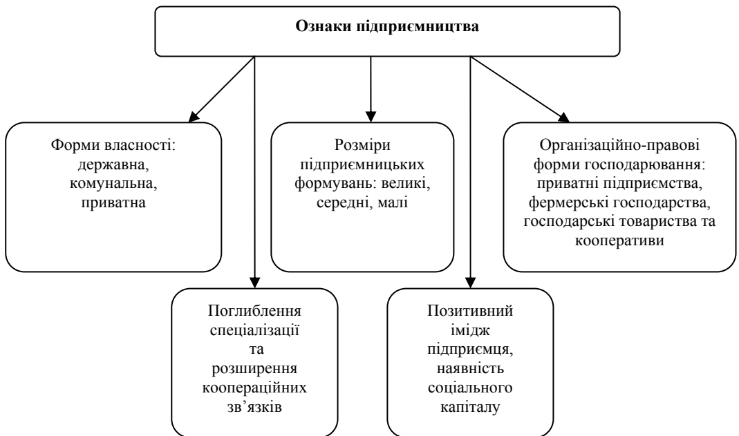
Рис. 1. Ключові ознаки формування та функціонування сільського підприємництва

Узагальнюючи особливості інституту підприємництва, можна виділити п'ять характерних ознак, які безпосередньо впливають на політику держави в сфері аграрного бізнесу (рис. 1).