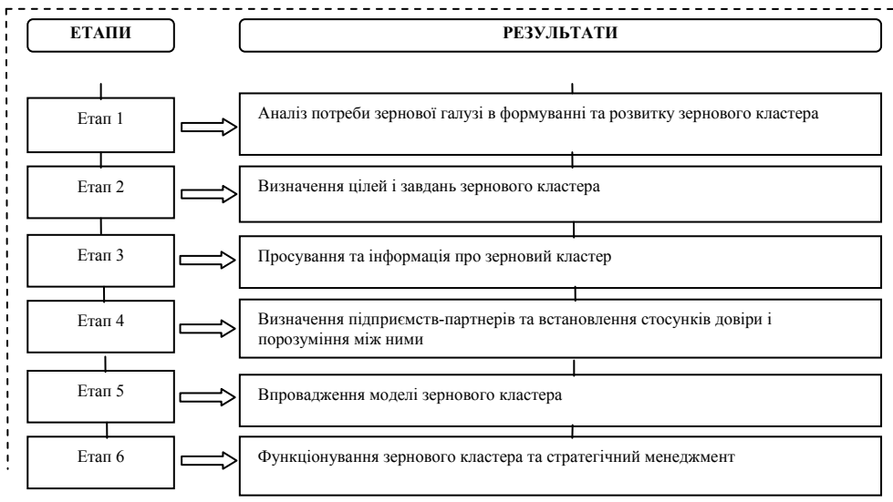
Рис. 1. Модель розвитку зернового кластера

Необхідною умовою функціонування зернового кластера є виділення етапів його створення та розвитку на рівні області (рис. 1).