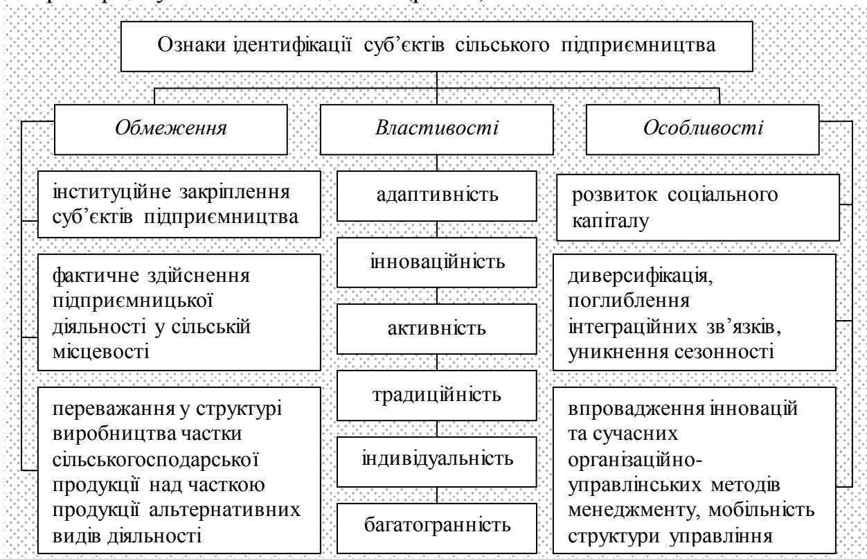
Рис. 1. Комплекс ознак ідентифікації суб'єктів сільського підприємництва

таких, що сприяють подоланню соціально-економічних та екологічних диспропорцій у сільській місцевості (рис. 1).