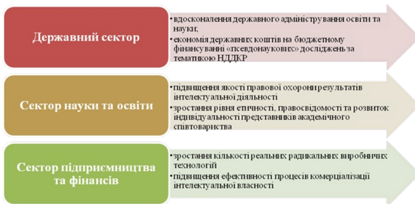
Рис. 2. Причини зацікавленості основних груп стейкхолдерів у реалізації дорожньої карти вирішення проблеми академічного плагіату

Вирішення проблеми академічного плагіату сприятиме створенню ряду можливостей для держави, науки, освіти та бізнесу (рис.2).