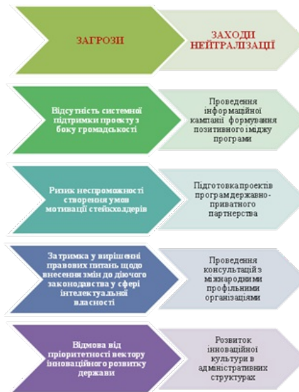
Рис. 5. Рекомендації щодо управління ризиками дорожньої карти

Реалізація проекту потребує визначення потенційних загроз імplementації програми «Антиплагіат Україна - 2025» та визначення дієвих кроків для швидкої нейтралізації таких загроз (рис.5).