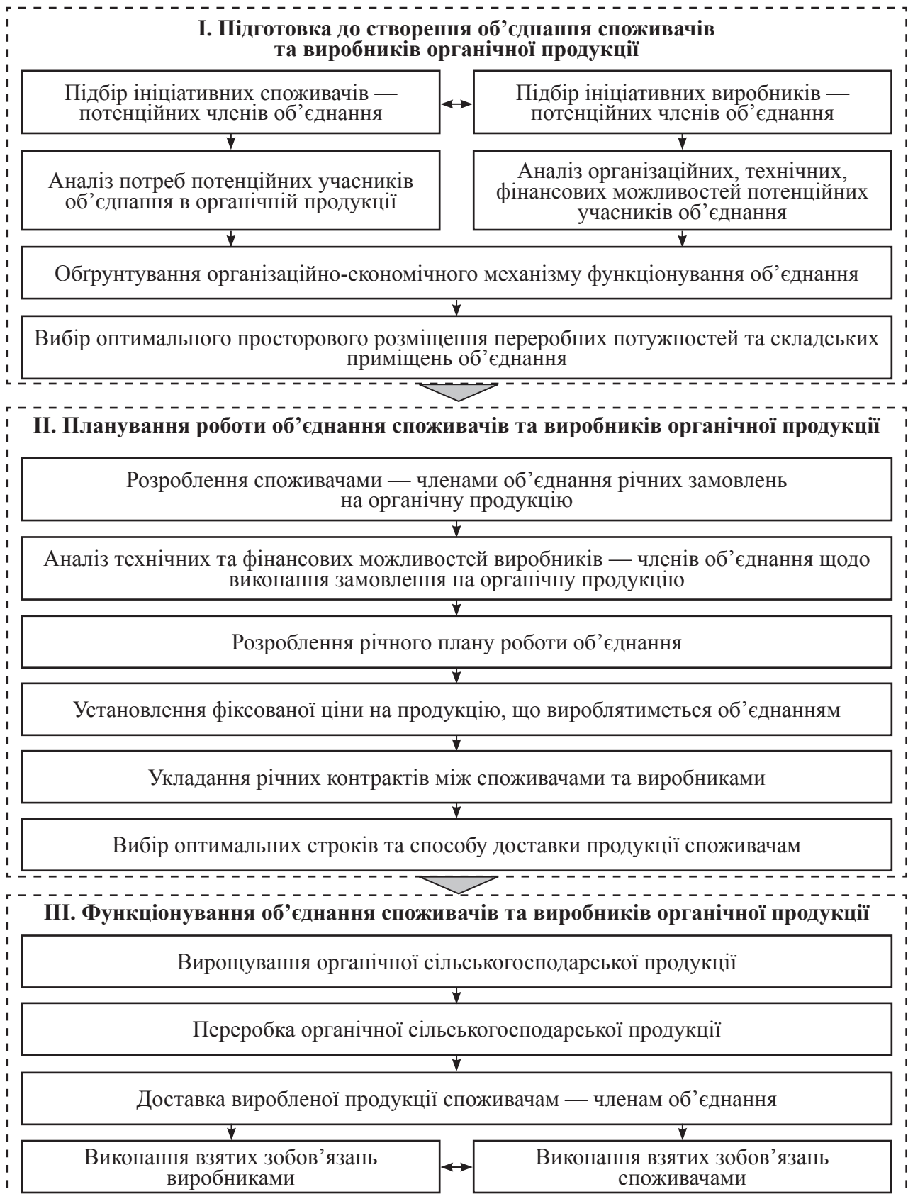
Рис. 4. Схема організації та функціонування об'єднання виробників і споживачів органічної продукції