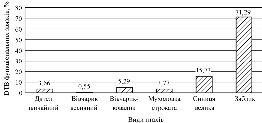
Рис. 1. Загальний бюджет часу орнітоконсорцій у чистому сосновому насадженні у весняно-літній період

кціонуванні консорції сосни звичайної чистих соснових насадженнях форичні та фабричні зафіксовані не були.