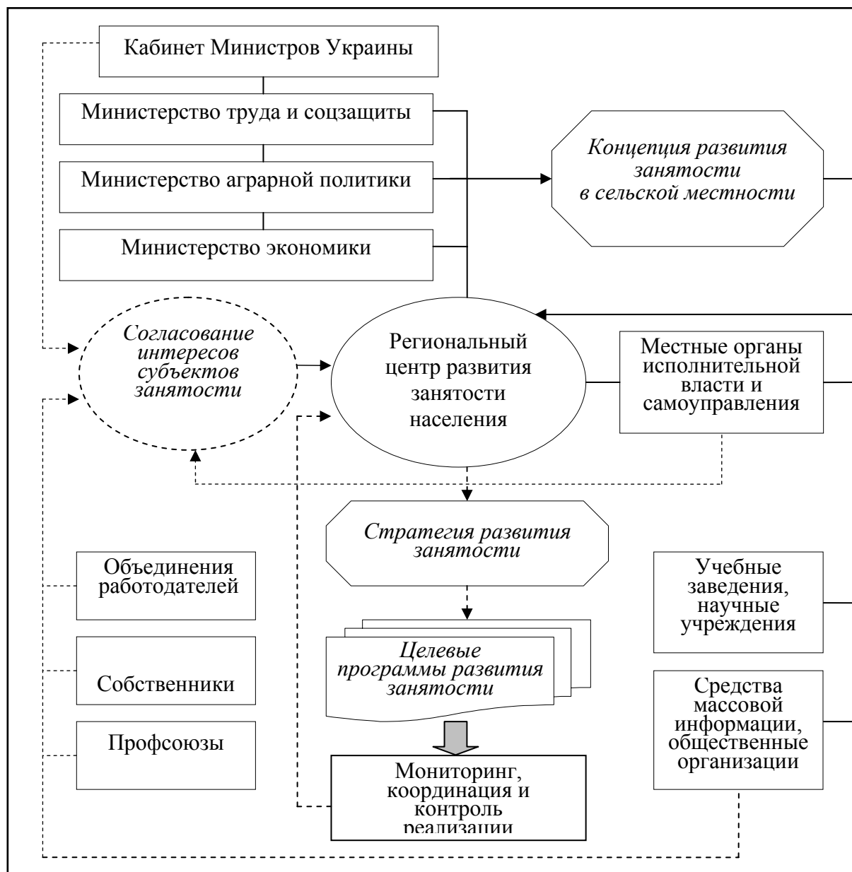
Рис. 1. Механизм взаимодействия субъектов политики развития сельской занятости

контексте не является исключением и вопрос реализации политики сельской занятости, нуждающейся в соответствующем информационном обеспечении, система которого должна включать оперативную информацию о численности безработных и качественных характеристиках вакантных мест на соответствующей территории.