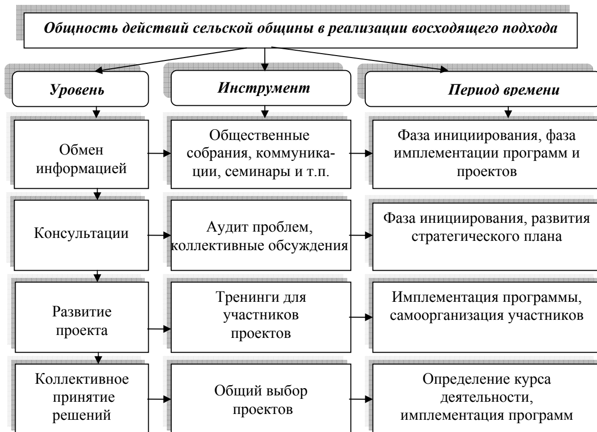
Рис. 3. Общность членов общины в политике развития села

В Украине в результате неразвитости институциональной среды для политики развития села не существует организации, которая бы взяла на себя такие функции. Именно поэтому необходимым является активное развитие сельскохозяйственных совещательных служб, которые на начальном этапе должны информировать сельскую общественность относительно возможности применения восходящего подхода в локальном сельском развитии и обеспечивать поддержку этого процесса.