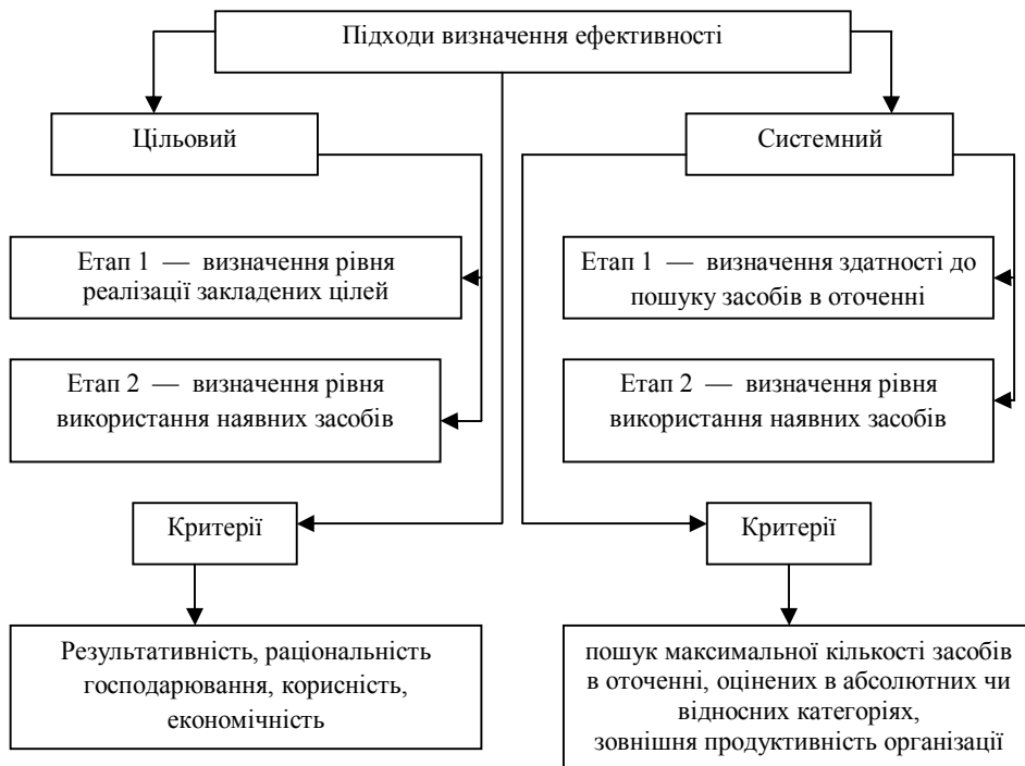
Рис. 1. Характеристика підходів до оцінки ефективного виробництва картоплі