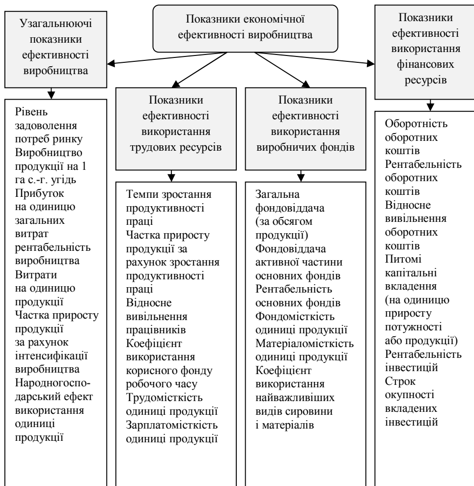
Рис. 3. Система показників економічної ефективності виробництва

Головне місце в економічному аналізі й обґрунтуванні господарських рішень міг би посісти єдиний узагальнюючий (інтегральний) показник економічної ефективності виробництва, який би відбивав результати сумісної дії окремих показників, що характеризують різні сторони ефективності. У вітчизняній та закордонній практиці не мають єдиного погляду на визначення цього показника, тому пропонується безліч його варіантів. Як правило, – це різні способи зведення одноразових і поточних затрат до єдиного виміру, вираження витрат живої та уречевленої праці в одному показнику [1, с. 19–25], зведення в один