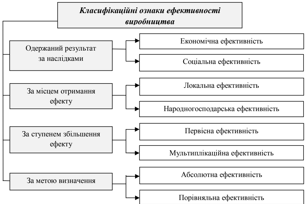
Рис. 2. Класифікація економічної ефективності за рядом ознак

На рис. 3 зображено систему показників ефективності виробництва. Їх згруповано за чотирма основними напрямками: узагальнюючі показники ефективності виробництва, показники ефективності використання трудових ресурсів, виробничих фондів і фінансових ресурсів.