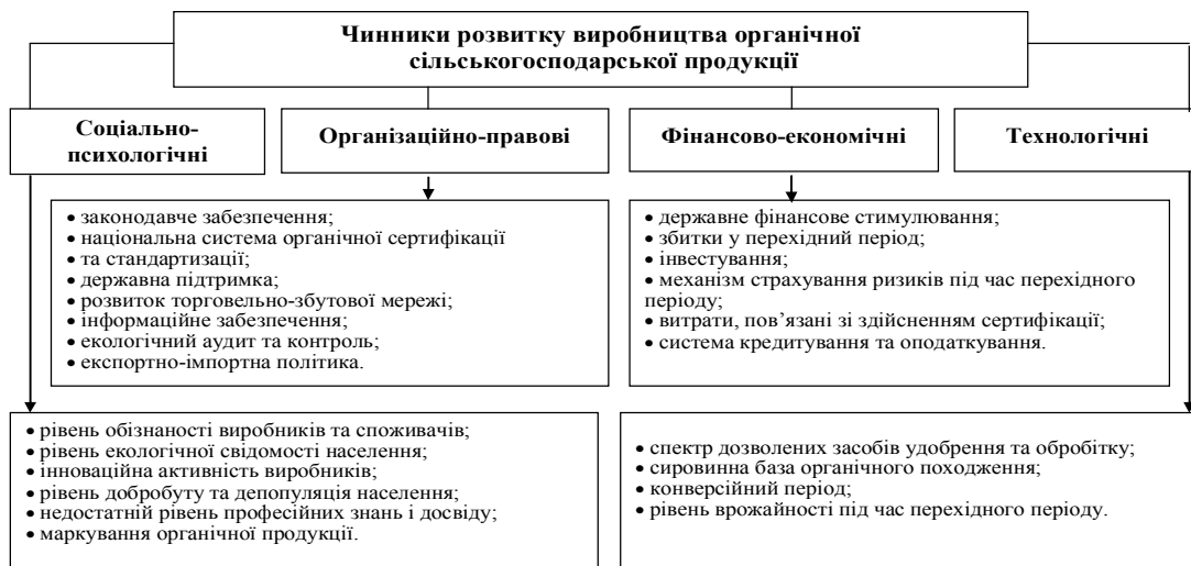
Рис. 2. Чинники розвитку виробництва органічної сільськогосподарської продукції в Україні

Однак, порівнюючи наведену інформацію з наявним потенціалом виробничих ресурсів та ємкістю вітчизняного ринку, можна стверджувати, що розвиток органічного сільського господарства відбувається надзвичайно повільно. На нашу думку, така ситуація зумовлена різноспрямованістю дії найбільш значущих для розвитку органічного виробництва чинників. Аналіз сучасного стану органічного сільського господарства та процесів, що впливають на його розвиток, дозволив систематизувати фактори впливу й виділити їх основні групи: соціально-психологічні, організаційно-правові, фінансово-економічні, технологічні чинники (рис. 2).