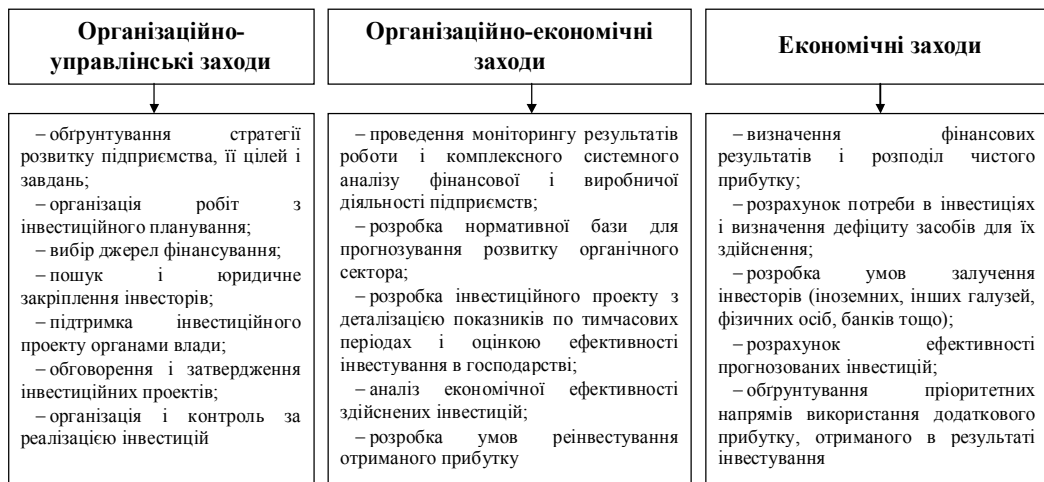
Рис. 3. Основні заходи активізації інвестиційної діяльності в органічному сільському господарстві

Отже, аналіз чинників, що впливають на розвиток органічного виробництва в Україні, дозволяє стверджувати, що більшості з них має більш стримуючий, ніж стимулюючий характер. Для усунення негативної дії цих факторів вважаємо за потрібне розробити Програму розвитку виробництва органічної сільгосппродукції в Україні на період до 2020 року, яка містила б комплекс відповідних заходів. Серед таких заходів обов'язковим має бути залучення додаткових інвестицій та посилення інвестиційного процесу в органічному сільськогосподарському виробництві (рис. 3).