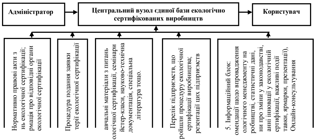
Рис. 1. Аналітична схема центрального вузла єдиної бази даних екологічно сертифікованих виробництв