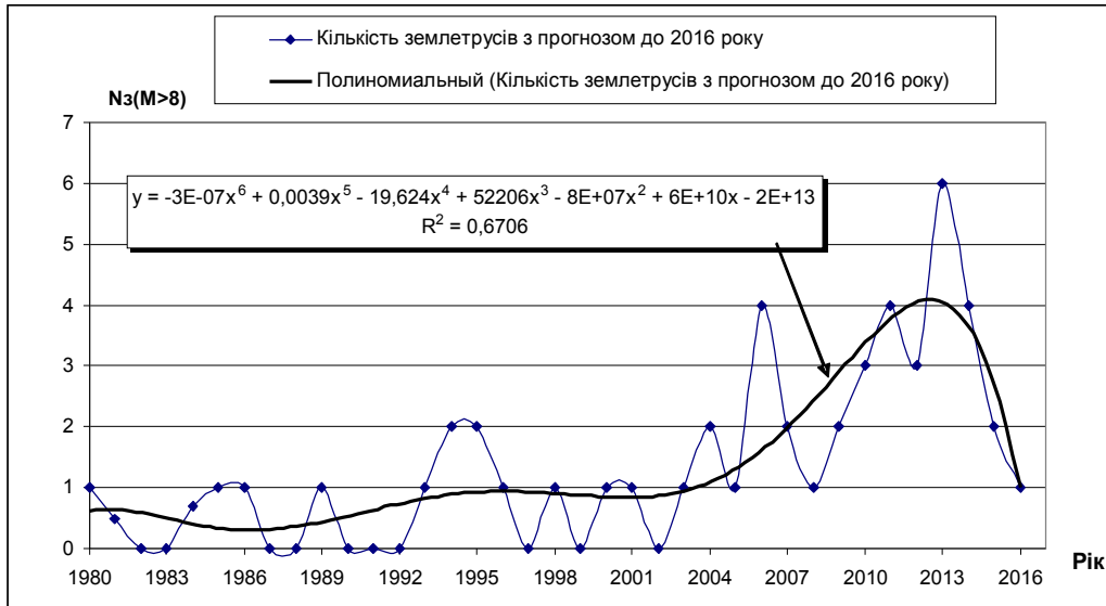
Рис. 2. Графік числа землетрусів з M > 8 за 1980 – 2010 роки з прогнозом до 2016 року.