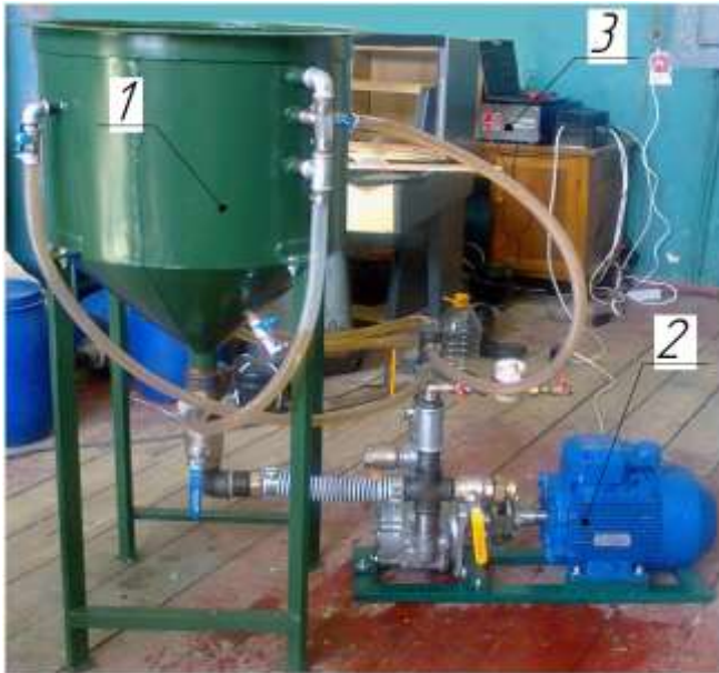
Рис. 1. Комплект обладнання для дослідної перевірки енергетичної ефективності виробництва дизельного біопалива в циркуляційних змішувачах:

Гідростанція складалася із шестеренчастого насоса НШ 100, спеціально розробленої запобіжної муфти, асинхронного електродвигуна потужністю 5 кВт та номінальною частотою обертання 1500 об/хв і системи трубопроводів, оснащених спеціальними лічильниками.