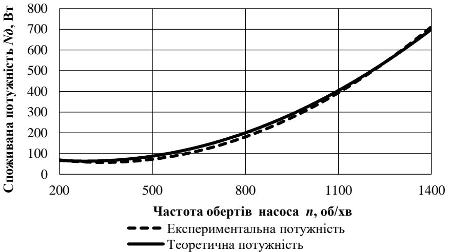
Рис. 3. Дослідна та теоретична залежності потужності N_d , від частоти обертання гідронасоса n (діаметр форсунки d_f = 17 мм)

Значення споживаної потужності, отримані внаслідок експериментальних досліджень, відповідають значенням потужності, розрахованим теоретично (рис. 3), відповідно до математичної моделі енергозберігаючого циркуляційного перемішування емульсії у циркуляційних змішувачах.