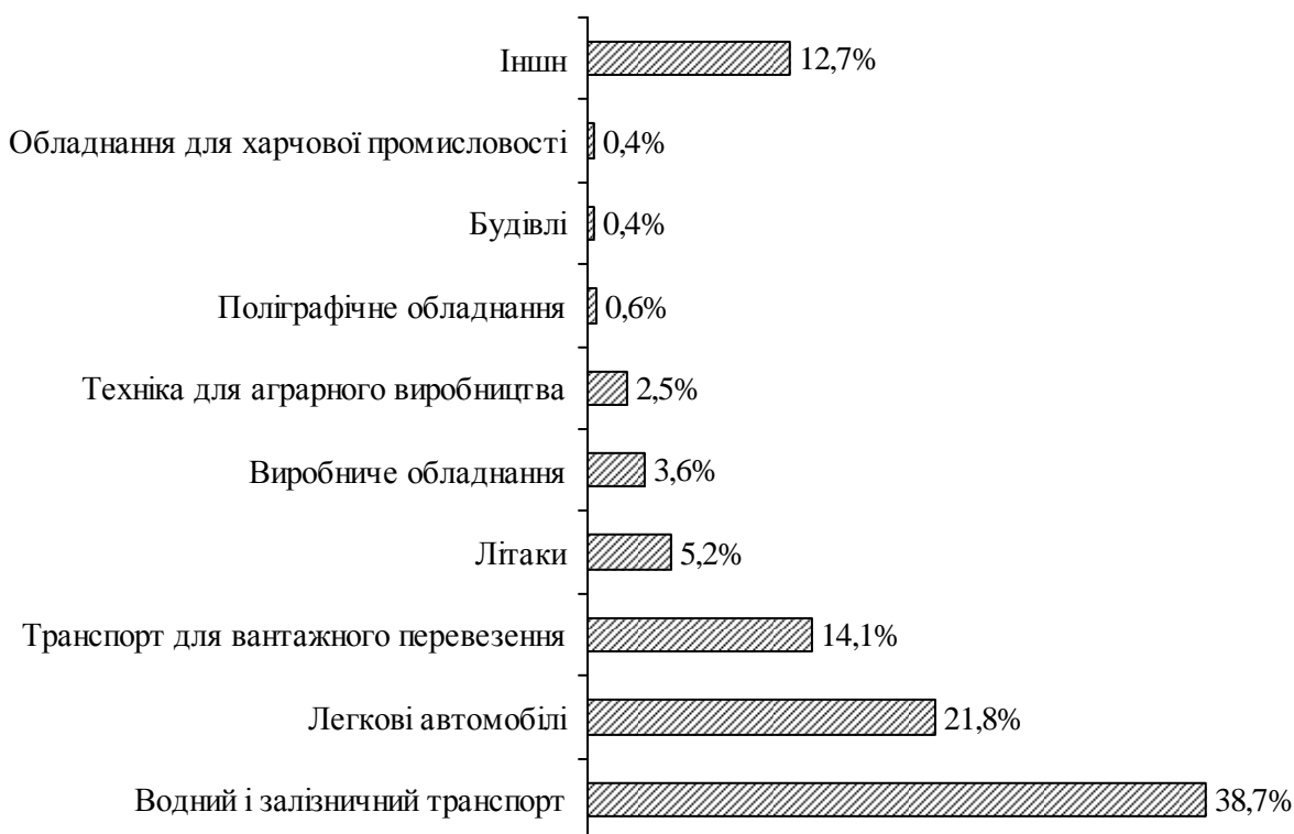
Рис. 2. Портфель лізингових компаній за видами активів, що надаються в лізинг (%).

Серед інших важливих факторів економічного стимулювання диверсифікації аграрних підприємств залишається механізм амортизації та його місце серед інших фінансових джерел. Формування амортизаційної політики держави полягає в управлінні державними органами влади процесом розроблення норм і правил нарахування амортизації, установлення порядку використання амортизаційного фонду.