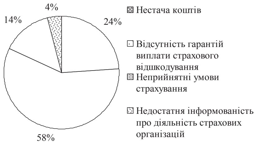
Рис. 2. Розподіл відповідей респондентів щодо проблем, що стримують страховий захист виробництва сільськогосподарської продукції

показник сягає 70-80 %. Недосконалість чинного законодавства у цій сфері призвело до взаємної недовіри у страхувальників та страховиків, а страхування виробниками сільськогосподарської продукції сприймається як вимушений засіб для отримання кредиту чи державної дотації. Більшість респондентів (67 %) сільськогосподарських підприємств Житомирської області відзначили, що не мають можливостей страхувати своє майно (рис. 2).