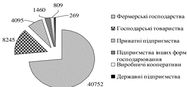
Рис. 3. Кількість діючих в Україні аграрних формувань у 2013 р.

Сімейні фермерські господарства (в Україні – 40752) змушені конкурувати з корпоративними формами господарств у продовольчому виробничо-збутовому ланцюзі. Іноді дрібні сімейні фермерські господарства виключаються зі стандартного процесу розміщення замовлень і продовольчого виробничо-збутового ланцюга навіть із-за необхідності укладання значної кількості контрактів (рис. 3) [3]. Пошук балансу інтересів слід здійснювати не у знищенні або дискримінації одного типу господарств на користь другого типу, а у максимальному використанні і підсиленні тих переваг, що мають агроформування обох типів.