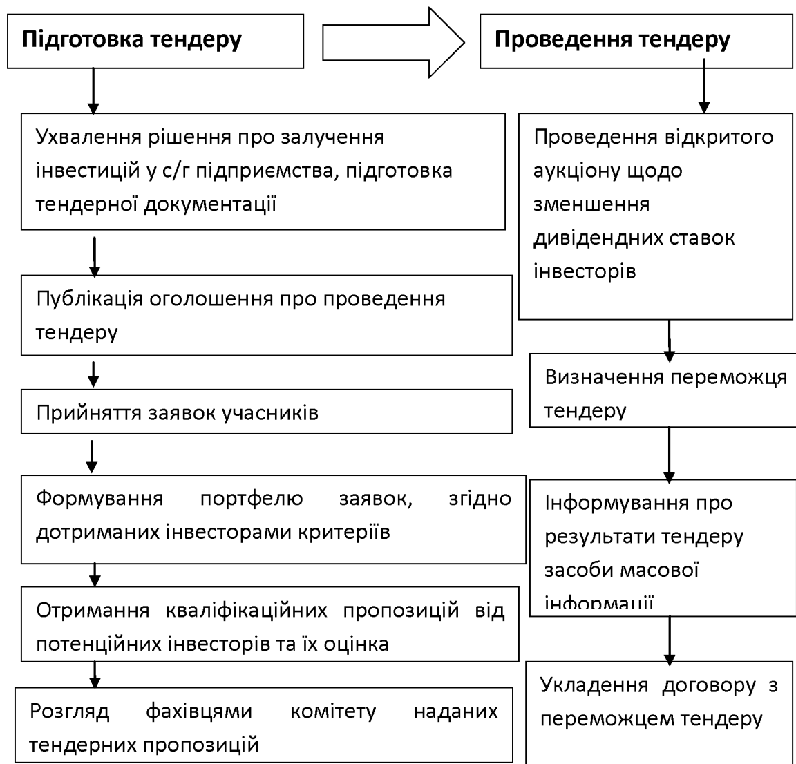
Рис. 1 Механізм тендерної системи на право інвестиційного забезпечення сільськогосподарської галузі Житомирської області в умовах підвищення фактора зайнятості населення регіону

тендерне забезпечення не повертається учаснику. Отже, учасник тендеру має можливість ще до отримання тендерної документації дізнатися про умови надання тендерного забезпечення в оголошенні про заплановане інвестування, яке друкується в спеціалізованих друкованих засобах масової інформації.