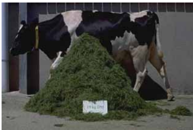
Рис. 3. Добове споживання пасовищного корму може досягати 19 кг сухої речовини але лише на високоякісних пасовищах

Після закінчення активного випасу тварин приганяють на територію ферми для відпочинку, підгодівлі та доїння. Тварин приганяють на тери-