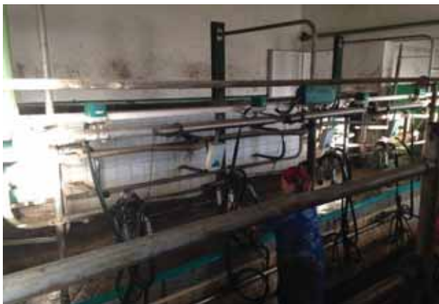
Рис. 4. Доїльна установка «Ялинка» на 4 місця

При підгодівлі тварин концентратами слід орієнтуватися на такі концентрати, які містять високі рівні перетравної клітковини (наприклад: буряковий жом, пивна дробина). Це пов'язано з повільними темпами розчеплення їх розщеплення в рубці, що не призводить до зниження рН рубця, зниження перетравності та споживання сухої речовини корму.