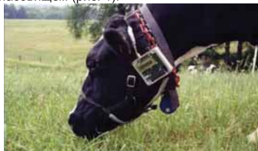
Рис. 1. Реєстрація жувальної поведінки

Слід зазначити, що в цілому суспільство сприяє випасу худоби і в більшості випадків така система утримання є економічно привабливою. В той же час більш дискусійними є ситуації для ферм з автоматизованими системами доїння та / або великими стадами. Але на думку вчених [4] використання сучасних автоматизованих систем машинного доїння можна адаптувати до пасовищного утримання корів шляхом застосування технічних та технологічних інновацій та управління пасовищем (рис. 1).