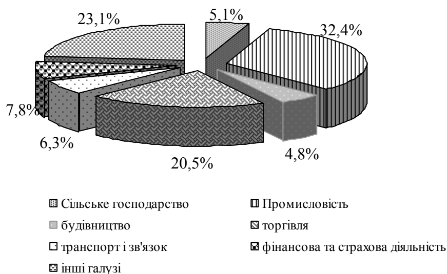
Рис. 1. Структура капіталу підприємств України за галузями економіки у 2012 р.

Виклад основного матеріалу. У сучасних умовах господарювання виникає необхідність формування на мікрорівні ефективного механізму управління фінансовими ресурсами, орієнтованого на зростання та ефективне використання об'єктів майнового потенціалу підприємств при забезпеченні їх стійкості та допустимого рівня ризиків. Ситуація з фінансового забезпечення галузі сільського господарства, що склалася в останні роки, не сприяє поліпшенню фінансового стану та забезпеченості фінансовими ресурсами підприємств галузі. Проведене дослідження структури фінансових ресурсів підприємств в Україні за галузями господарства станом на 1.01.2012 р. (рис. 1) свідчить, що найбільша частка у загальній їх сумі припадала на промислові підприємства (32,4 %). Частка підприємств галузі сільського господарства, мисливства та лісового господарства порівняно незначна і становила 5,1 %.