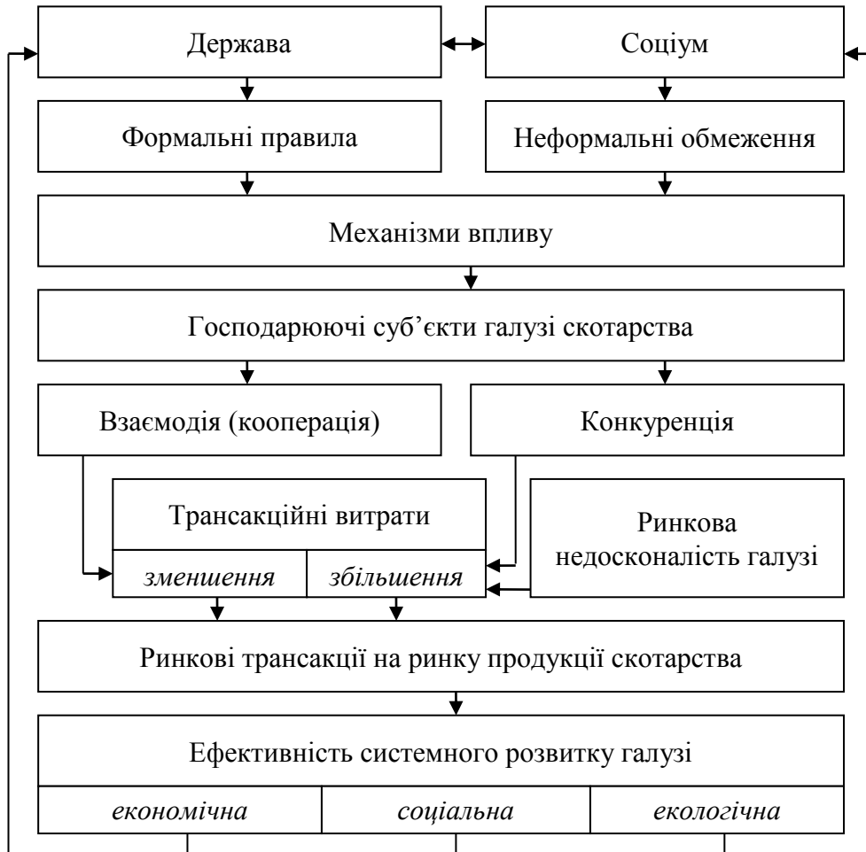
Рис. 1.3.3. Вплив інституціональної структури на ефективність системного розвитку галузі скотарства

Стратегічне значення галузі не обмежується виключно економічним призначенням. Забезпечення системності в розвитку галузі скотарства має відбуватися під впливом трьох рівноважливих доміант – економічної, соціальної та екологічної. З огляду на це постає стратегічне завдання системного розвитку скотарства – обґрунтувати систему нових, адекватних ринковій економіці та демократичному суспільству, «правил гри» формального й неформального характеру, тобто економічних інститутів, а також інституцій як механізму закріплення цих норм у суспільстві. Галузеве спрямування предмета наукового пошуку в даному дослідженні ілюструє вплив "правил гри" на остаточний результат – ефективність системно упорядкованого розвитку галузі скотарства (рис. 1.3.3).