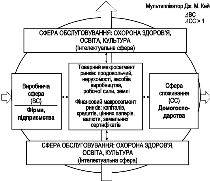
Рис. 2. Стержневий гештальт (образ) інтелектуальної економіки

Активізація дії внутрішнього середовища вимагає нормалізації системи оплати інтелектуальної праці за еквівалентом складної кваліфікованої, формулу якої визначив ще в 1790 р. Адам Сміт: праця спеціаліста – це подвоєна проста, але це нижня межа для розрахунків, а далі йде наступна тарифікація – бакалавр, магістр, доктор філософії, доктор наук.