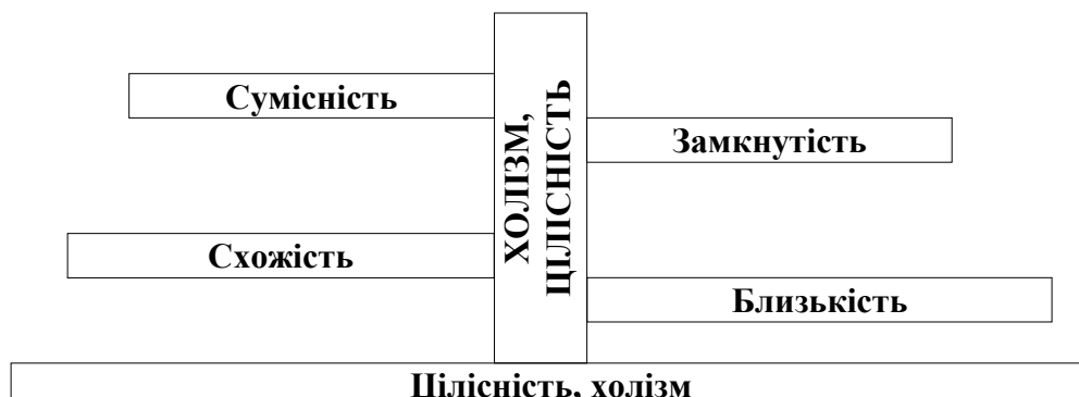
Рис. 2. Дерево гештальту

Поняття «гештальт» Gestalt (нім.) – це фігура, образ бачення, уява, контур рельєфності, цілісності. Характерно виражений у статті Х. Еренфельса «Про якість функції», В. Кьолера «Фізичні гештальти у спокої і стаціонарному стані», розробки Фредеріка і Лаури Перлз у галузі психології засвідчують, що гештальт – це цілісний образ (уява) будь-якої структури, що практично не виводяться з компонентів, які її утворюють, а сам гештальт – це просторово-наочна форма предметів (явищ, схем, подій), що сприймаються, чий властивості неможливо зрозуміти сумуванням властивостей їх частин.