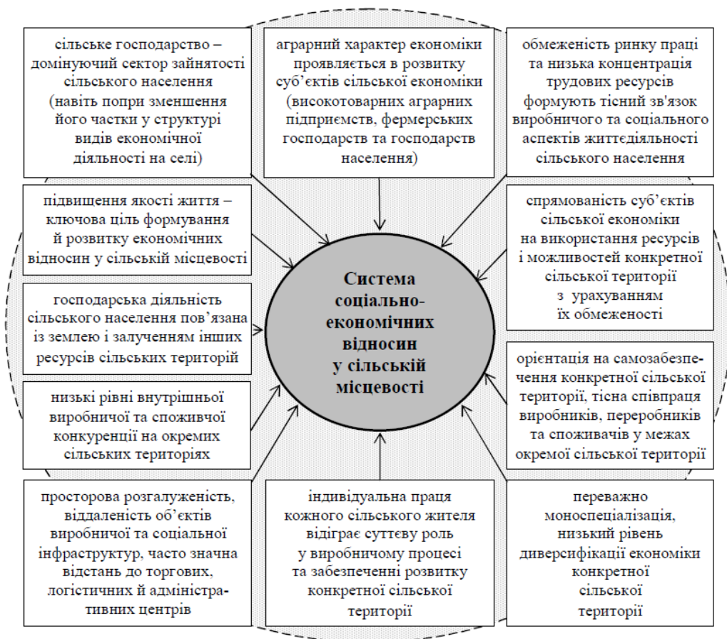
Рис. 1. Характерні особливості, що формують систему соціально-економічних відносин у сільській місцевості

пояснюється об'єктивною доцільністю трактування цих понять з урахуванням їх змістовного наповнення та обґрунтування функціонального призначення, а саме – трансформації галузевого аспекту розвитку в територіальний, де сільське господарство розглядається лише базовою основою сільської економіки.