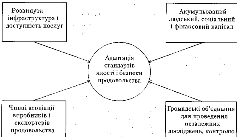
Рис. 2. Фактори успіху в адаптації стандартів якості і безпеки продовольства

родних вимог. У цьому процесі важливу позитивну роль можуть відіграти незалежні організації з сертифікації. У країнах з низьким рівнем ефективності регулювання якості продукції чи за наявності стереотипів, які негативно впливають на сприйняття продукції в країні-імпортері, використання зовнішніх контролюючих організацій є способом встановлення довіри до якості експортованої продукції. У сфері агропродовольчого експорту залучення зарубіжних контролюючих фірм є звичайною практикою. Щодо органічної продукції - широко розповсюдженою є співпраця з зарубіжними органами з сертифікації, оскільки споживачі країни-імпортера більшою мірою схильні довіряти органічним продуктам, маркованим національним органом сертифікації. Наразі ідентифікується ряд факторів, які забезпечують передумови для успішного впровадження стандартів якості і безпеки продовольства як ключового чинника активізації експорту (рис. 2).