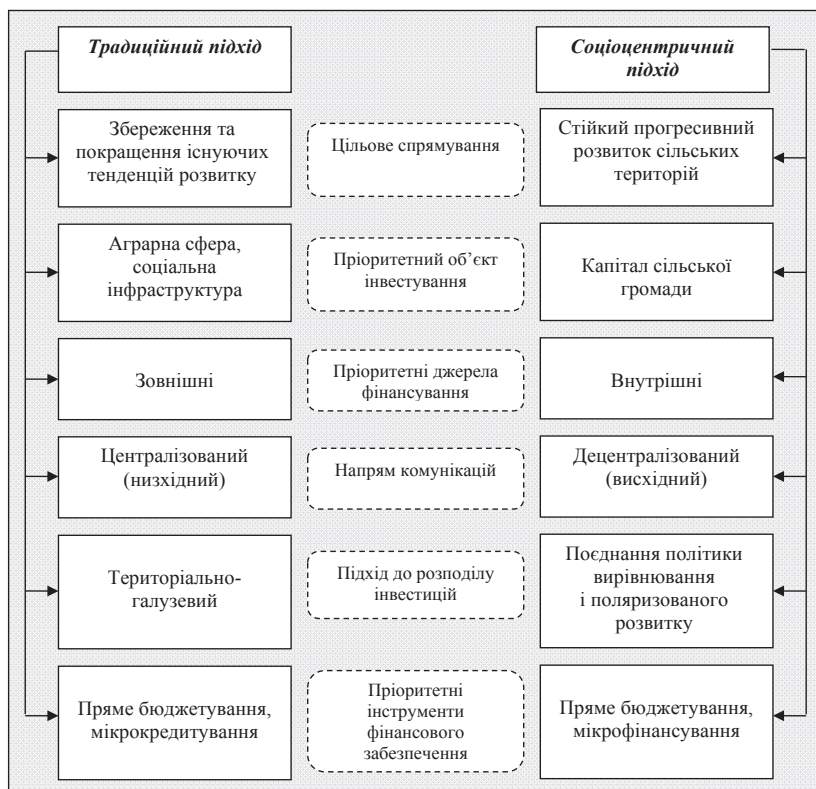
Рис. 2. Порівняльна характеристика традиційного та соціоцентричного підходу до фінансового забезпечення інвестиційної діяльності на сільських територіях

– для типово сільських територій, що характеризуються наявністю сприятливих умов для