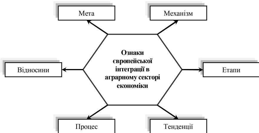
Рис. 1. Багатогранник ознак європейської інтеграції в аграрному секторі економіки

Сучасні принципи європейської інтеграції в аграрному секторі економіки являють собою органічну систему та додають визначеності щодо забезпечення стійкості його розвитку, дозволяють розв'язати конкретні завдання галузі у певний період часу, сприяють створенню конкурентного середовища, враховуючи взаємозв'язок екзогенних та ендегенних факторів. Авторські узагальнення різноманітних підходів до виділення характерних рис європейської інтеграції та виконані щодо цього дослідження дають можливість розцінювати європейську інтеграцію в аграрному секторі як складну динамічну систему з відповідними ознаками (рис. 1).