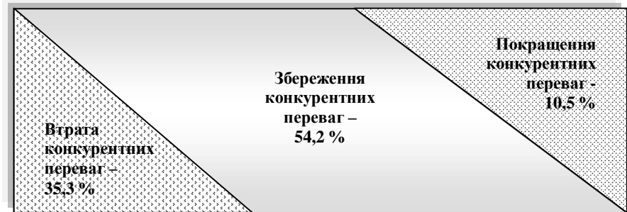
б) на світовому ринку