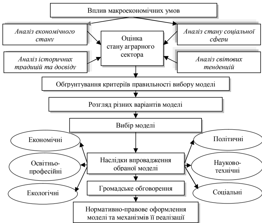
Рис. 2. Алгоритм формування моделі розвитку інтеграційних процесів в аграрному секторі економіки

досвіду інтеграції країн ЦСЄ. Дослідження окреслених проблем є важливою передумовою прискорення процесу інтеграції аграрного сектора в умовах європейського вибору.