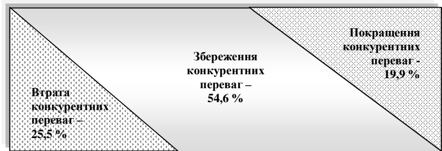
а) на європейському ринку

Використання запропонованої моделі має дві вагомні переваги (рис. 5).