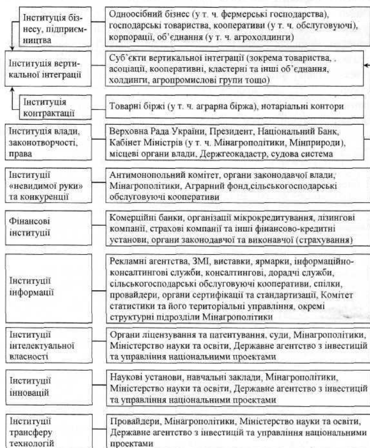
Рис. 2. Базові організації інституційного середовища сільськогосподарського підприємства

Недєвість інституції контрактатції ускладнює реалізацію механізмів «невидимої руки» через те, що при здійсненні ринкових операцій умови диктує не ринок, а сторона, яка займає більш вигідні позиції. Особливо це позначається на процесах ціноутворення, коли ціна нав'язується виробникам сільськогосподарської сировини [3, с 319]. У такій ситуації інституції «невидимої руки» покликані не тільки скоротити невизначеність ринкової кон'юнктури, але й мінімізувати вплив корпоративних структур та об'єднань на кон'юнктуру ринку сільськогосподарської продукції та умови ринкових угод. Скорочення дії невизначеності досягається через укладання контрактів (інституція контрактатції за участю згаданих вище організацій), неформальні домовленості (інституція соціального капіталу), дії органів законодавчої (при плануванні державного бюджету щодо держзакупівель) та виконавчої (передусім Мінагрополітики та його структурних підрозділів) влади. Обмеження впливу крупних підприємств здійснюється органами державної влади та через