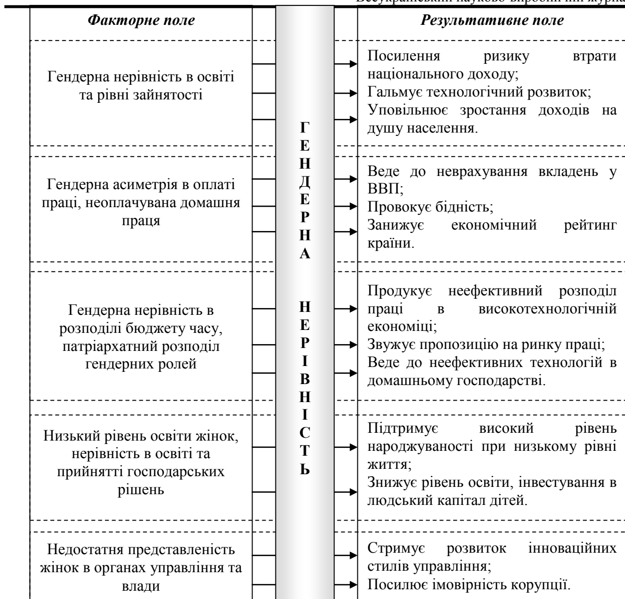
Рис. 1. Вплив гендерної нерівності на економічний розвиток