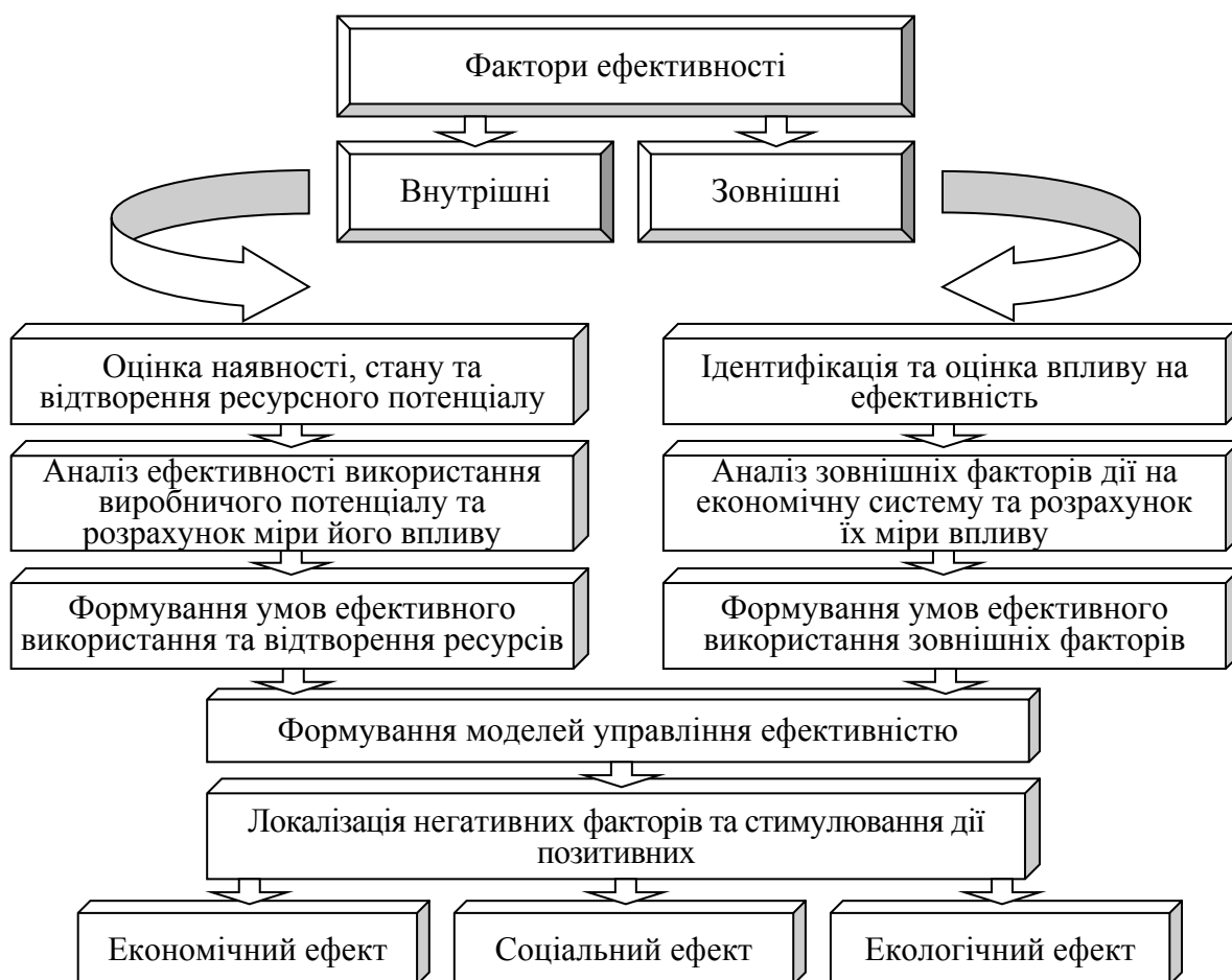
Рис. 3. Механізм реалізації шляхів підвищення ефективності діяльності сільськогосподарських кооперативів

В ході дослідження виявлено вплив зовнішніх факторів на успішне здійснення бізнесової діяльності кооперативу, які поділяються на економічні, законодавчі та політичні. Об'єктивно нейтралізувати дію цих факторів практично неможливо, однак сільськогосподарські товаровиробники, об'єднуючись у кооперативи, в змозі зменшити негативний вплив ринкового середовища. Перш за все, це пояснюється перевагами кооперативу, оскільки спільно можна досягати того, чого не можна досягти поодиночки, завдяки можливості координації своїх дій з іншими товаровиробниками, виходу на ринки, участі у великомасштабному бізнесі. Узагальнені результати дослідження щодо забезпечення підвищення ефективності функціонування кооперації подано на рис. 3. При цьому досягнення високих результатів господарювання сільськогосподарських кооперативів можливе завдяки виявленню та нейтралізації негативних факторів та стимулюванню дії позитивних, зокрема удосконалення організаційної структури, збалансування виробничого потенціалу, впровадження нових технологій. Реалізація внутрішніх і зовнішніх факторів підвищення ефективності діяльності кооперативів забезпечить отримання не лише економічного ефекту, а й соціального та екологічного.