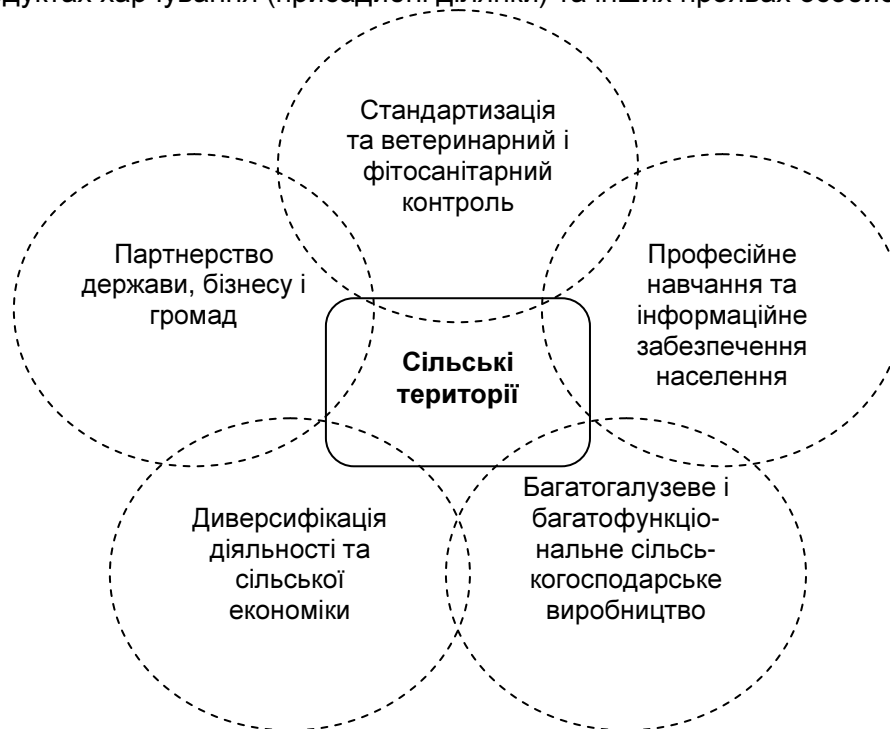
Рис. 1. Концептуальні засади інвестиційного розвитку сільських територій

Вирішення питань відродження села супроводжується розв'язанням завдань проблемних земель, зокрема тих, які займали села, що зникли після об'єднання господарств в часи колективізації; спустошені землі в існуючих селах; землі, вивільнені після упорядкування та меліорації лісосмуг, ставів та зруйнованих ерозією ґрунтів тощо. Передача цих земель у довічне використання є запорукою відродження села на принципово нових соціально-економічних основах. Єдність людини з родом закладена Богом проявляється як в бажанні бути ближче до природи під час відпочинку чи проживання, з метою забезпечення своїх потреб у продуктах харчування (присадибні ділянки) та інших проявах особистості.