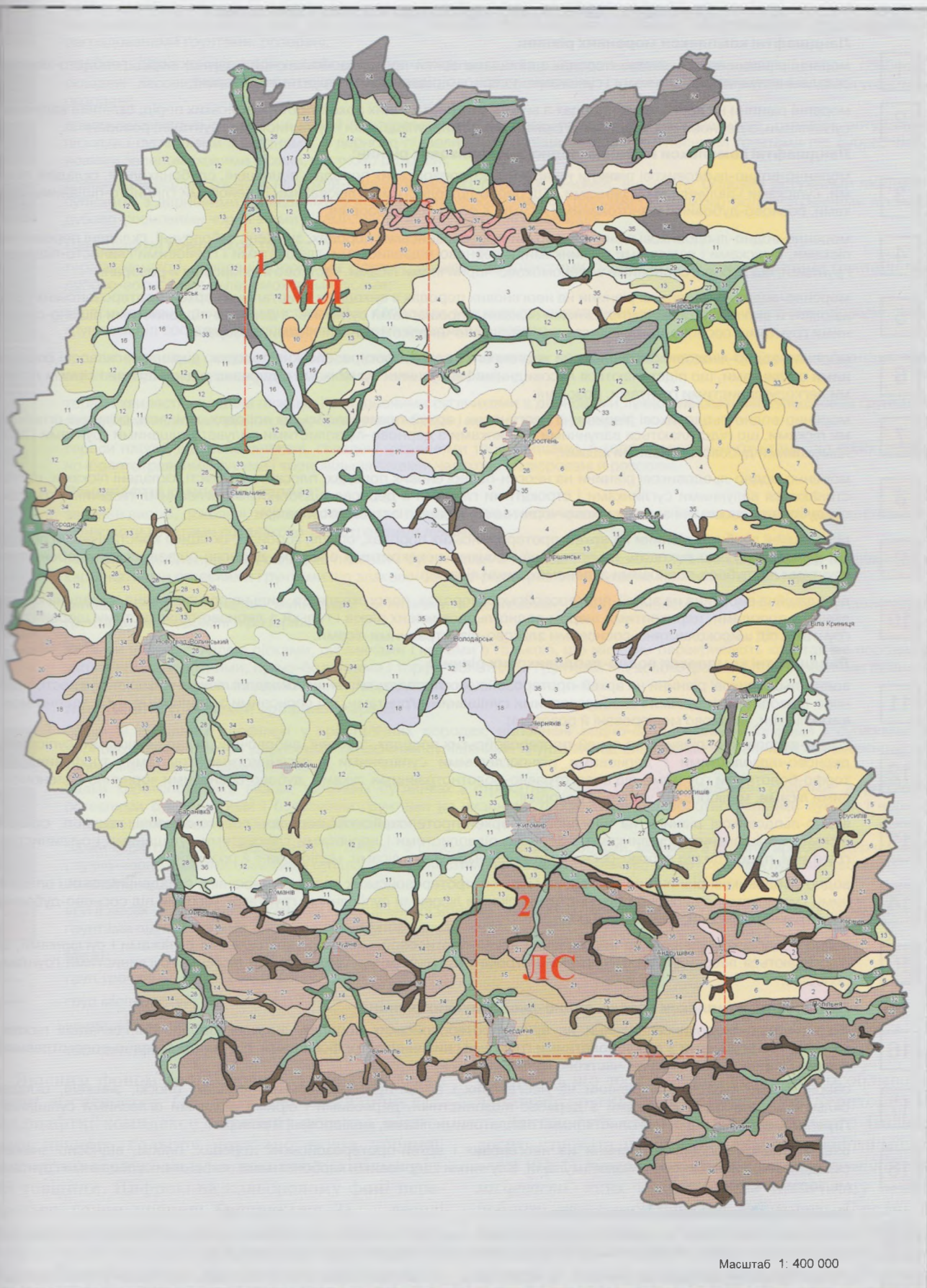
Мал. 2. Ландшафтна картосхема Житомирської області