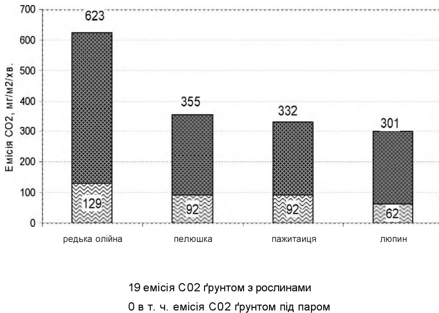
Рис. 3. Структура обсягів емісії оксиду вуглецю ґрунтом під сидеральними травами та ґрунтом під паром

Доволі інформаційним є показник співвідношення величин емісії CO 2 ґрунтом під сидеральними культурами та ґрунтом без рослин (рис. 3).