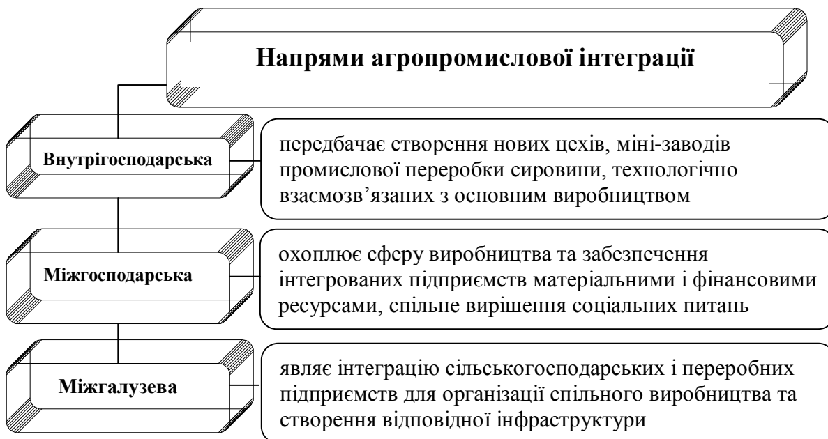
Рис. 1. Напрями агропромислової інтеграції залежно від організаційної форми ведення виробництва

особливості та може застосовуватися залежно від стратегічної спрямованості діяльності підприємства.