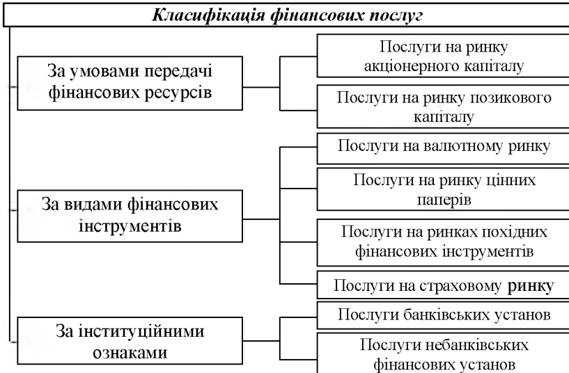
Рис. 1.1. Класифікація фінансових послуг

За умовами передачі фінансових ресурсів в користування фінансові послуги доцільно поділити на ті, що надаються на ринку акціонерного та позикового капіталів. На ринку позикового капіталу фінансові посередники забезпечують передачу ресурсів на визначений термін та під проценти за допомогою боргових цінних паперів або кредитних інструментів. До фінансових послуг на ринку позикового капіталу належать: надання грошей у позику банківськими та небанківськими кредитно-фінансовими установами, фінансовий лізинг, факторинг та форфейтинг, надання гарантій та поручительств тощо.