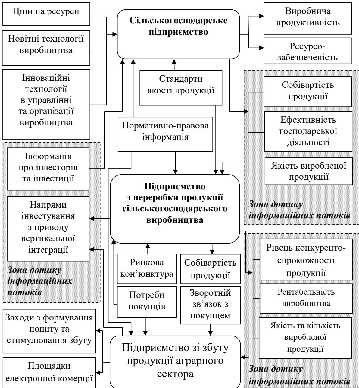
Рис. 1. Основні інформаційні потоки підприємств, задіяних в маркетинговому ланцюгу продукції аграрного сектора

критеріїв підбору партнерів з урахуванням їх релевантності, теоретичних та методичних засад створення системи управління інформацією в інтегрованій структурі, методологічних основ вертикальної інтеграції підприємств. З точки зору процесного підходу до створення вертикально інтегрованих об'єднань, цікавить вхідна та вихідна інформація щодо кожної ланки підприємств, що входять до складу об'єднання (рис.1).