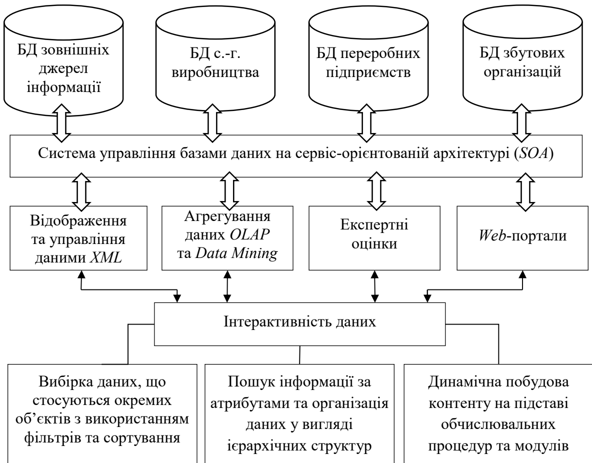
Рис. 3. Побудова загальної бази даних вертикально інтегрованого об'єднання

Виявлення перспективи створення вертикально інтегрованого об'єднання на основі реальних результатів діяльності та знаходження оптимальних шляхів розвитку такого процесу є задачами економічного моделювання. Побудова економіко-математичної моделі набуває ролі ключового інструменту теоретичних та практичних економічних досліджень. Зазначена модель повинна бути адекватною дійсності та відображати основні параметри процесу, що досліджується.