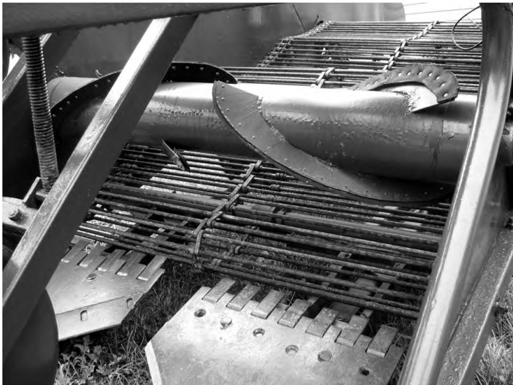
Рисунок 2 - Лабораторно-польова установка на базі картоплекопача КСТ-1.4А

Для проведення випробувань була розроблена лабораторно-польова установка на базі картоплезбиральної машини КСТ-1,4А. На неї встановлений розрихлювач-вирівнювач, привід якого здійснювався від гідросистеми трактора. Регулювання частоти обертання барабану розрихлювача здійснювалось за допомогою гідродроселя (рис. 2).