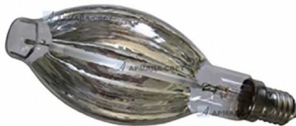
Рис. 1. Загальний вигляд лампи ДНаЗ супер/Reflux S 600 Спектр лампи ДНаЗ супер/Reflux S 600 групується навколо 600 нм.

Лампа ДНаЗ супер/Reflux S 600 випускається з електронним пускорегулюючим пристроєм в звичайному і герметичному корпусі патроном E40 і кабелем живлення.