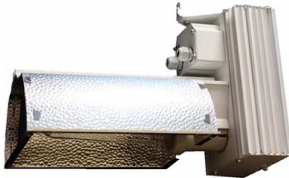
Рис. 3. Загальний вигляд світильника ЖСП 64 - 600 - 002/380 В

Світильник ЖСП 64 - 600 - 002/380 В, призначений для освітлення рослин в тепличних комплексах з номінальною напругою в мережі 320 -420 В.