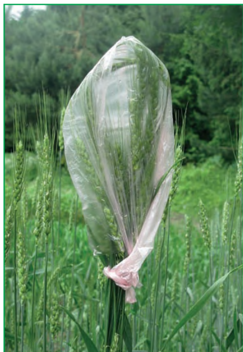
Рис. 1. Створення умов підвищеної вологості для колосця пшениці озимої за допомогою ізолатів

насіння закладали у вологу камеру для визначення мікрофлори насіння. Для цього розміщували насіння в чашки Петрі на ложе з 2-х кругів фільтрувального паперу, змоченого стерильною водою в кількості 8 мл на одну чашку. Кількість насінин в 1 чашці — 25 штук, повторність — чотириразова. Чашки поміщали в термостат при температурі 25—26°C. На сьому добу кожну зернину, не виймаючи її з чашки, оглядали на наявність інфекції (рис. 2). Для підтвердження ураження фузаріозом виготовляли препарати, які розглядали під мікроскопом.