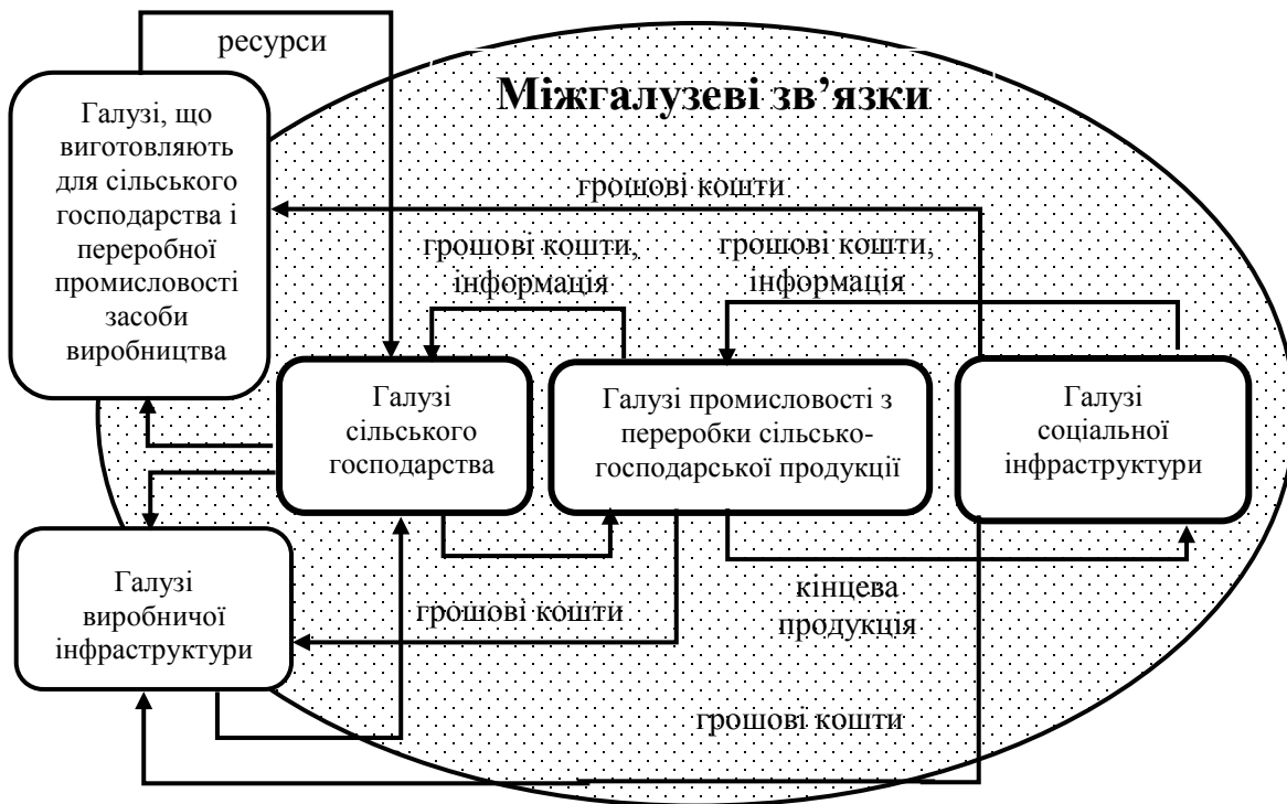
Рис. 1. Взаємозв'язки між галузями аграрного сектору економіки*

Доведено, що структура аграрного сектору ґрунтується на виділенні у його складі окремих галузей, між якими існує міцний взаємозв'язок: 1) виробництво засобів для аграрного сектору; 2) виробництво продукції рослинництва і тваринництва; 3) виготовлення продуктів харчування і товарів широкого вжитку зі сільськогосподарської сировини; 4) реалізація кінцевої продукції; 5) обслуговування всіх стадій агропромислового виробництва (рис. 1). Обґрунтовано, що лише при створенні ефективних міжгалузевих відносин можливий вільний рух ресурсів та продукції від виробника до кінцевого споживача.