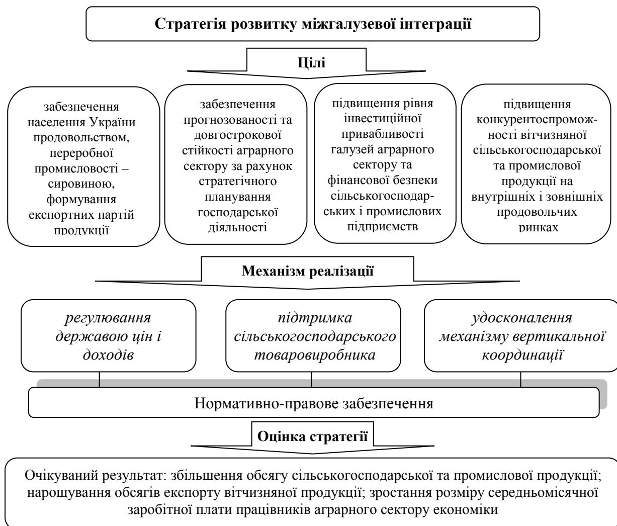
Рис. 2. Стратегія розвитку міжгалузевої інтеграції в аграрному секторі економіки*

задоволення потреб споживачів, збільшення дохідності аграрних формувань, уникнення дискримінації з боку переробних і торгівельних підприємств та забезпечення стабільного функціонування сільських територій.