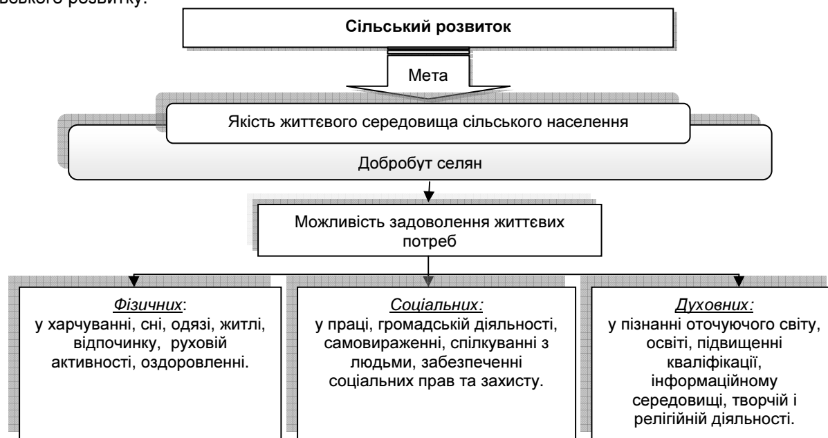
Рис. 3. Формування мети сільського розвитку у контексті людських потреб

внутрішньо необхідні, сталі й суттєві зв'язки між зростанням інтенсивності праці (у першу чергу, розумової), навантажень на організм людини в умовах забрудненого довкілля і його погіршення та необхідністю задоволення зростаючих екологічних потреб задля відтворення людини як біологічної істоти, природного компонента робочої сили нормальної якості, заходи екологічної політики у сфері сільськогосподарського природокористування в цілому мають посідати особливе місце у програмах сільського розвитку.